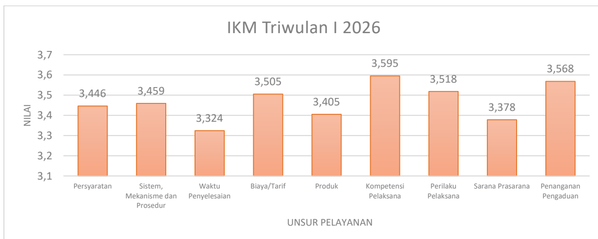
Gambar 1. SKM Total Kuisioner 9 unsur Triwulan I Tahun 2026

Berdasarkan hasil analisis SKM pada Tabel 2 secara keseluruhan, nilai Survey kepuasan masyarakat terhadap BRMP Tanaman Hias sudah "baik" dilihat dari kinerja unit pelayanan yang dinilai sangat baik pada semua unsur pelayanan.